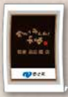
認定プレート (アクリル製B5サイズ)