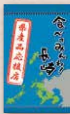
認定タペストリー (W250mm×H410mm)