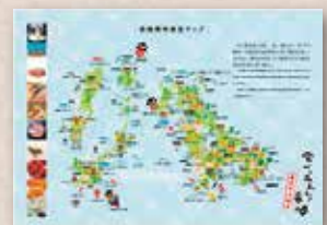
ペーパーランチョンマット (紙製A3サイズ)