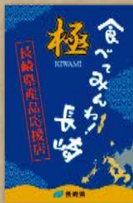
認定タペストリー