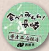
認定ステッカー (直径150mm)